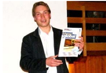
Nationalrat Lukas Reimann will die Abstimmungsinformationen seitens des Bundes abgeblockt haben.