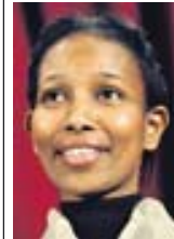
Ayaan Hirsi Ali.

MOGADISCHU • Die Somalierin Ayaan Hirsi Ali (39) flüchtete mit 23 Jahren von ihrem Mann in Kanada in die Niederlande. Nach eigenen Angaben wurde sie mit ihm zwangsverheiratet. Seit 2002 ist Hirsi Ali für ihre scharfe Islamkritik bekannt. Seit der