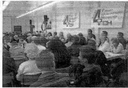
Die Junge SVP mit Young4FUN stellte sich am Kongress in Wil ebenfalls als EU-kritisch.