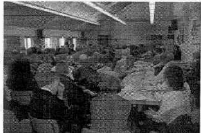
Da wurde auch eifrig notiert, was aus dem Munde der zahlreichen Referenten kam.