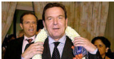
Nicht nur im Karneval für jeden Spaß zu haben: Bundeskanzler Gerhard Schröder (SPD)