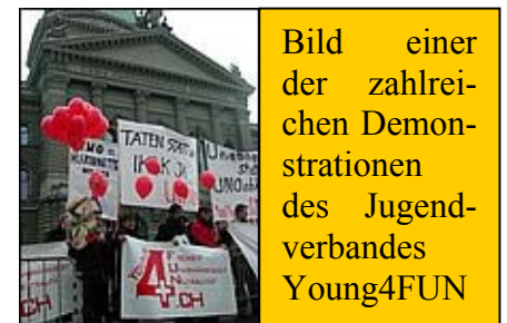
Bild einer der zahlreichen Demonstrationen des Jugendverbandes Young4FUN

DZ: Lukas, vielen Dank für das interessante Interview und weiterhin viel Kraft für Deine zahlreichen Aktivitäten, natürlich insbesondere im Kantonsrat von St. Gallen.