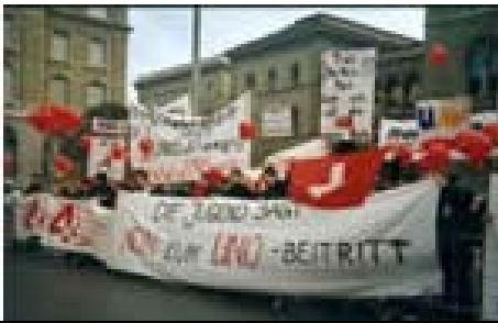
Young4Fun-Demonstration gegen einen UNO-Beitritt der Schweiz am 26.01.02 in Bern.

stimmung hat das Gros der SVP-Wähler die Armee XXI aber abgelehnt.